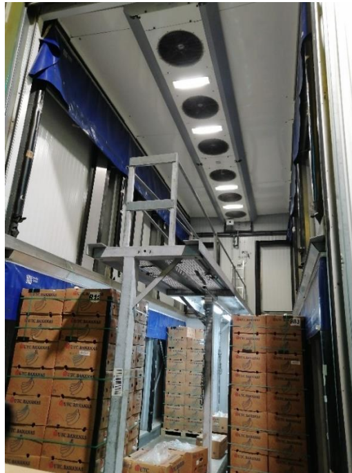
Img. 1 Foto de una cámara de maduración.

Nuestro Software también es capaz de controlar la aplicación de gas durante la maduración, pudiendo ajustar la duración de la gasificación. Mediante la lectura directa de los sensores instalados en la cámara de maduración, el Software indicará la cantidad de gas presente en la sala de maduración. Se controla a tiempo real la necesidad de inyectar etileno o eliminarlo mediante un venteo de la cámara. La duración y el intervalo de la ventilación son ajustables, durante los períodos de gasificación la ventilación se bloquea. El Software siempre indica cuando la cámara está siendo ventilada.